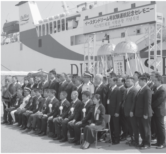
試験運航の記念セレモニーに出席した皆さん

境港市と韓国・東海市を結ぶ定期貨客船は、正式就航が8月3日に決まりました。この貨客船・イースタンダードリーム号が試験運航でことし5月26日に、境夢みなとターミナル(竹内団地)に入港。記念セレモニーなどが行われました。