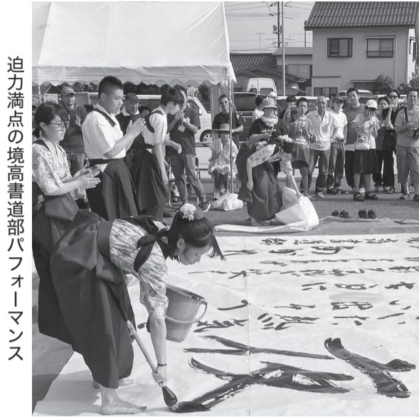
迫力満点の境高書道部パフォーマンス