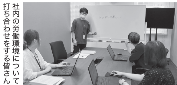
社内の労働環境について打ち合わせをする皆さん

同社では、2023年に鳥取県男女共同参画推進企業の認定を受け、誰もが働きやすい職場の環境づくりを積極的に推進しており、次世代育成支援対策推進法、女性活躍推進法の行動計画もそれぞれ実施中です。