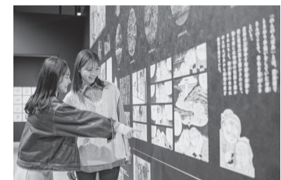
常設展示室第1章「境港の水木しげる少年」

幼い頃の水木先生に、こうした妖怪やあの世の話をお話されたのが皆さんご存じ、のんのんばあです。漫画家、そして妖怪研究家としての水木先生を育んだ境港はどんな町だったのか。気になる皆さんは、ぜひ記念館に足を運んでみてください。