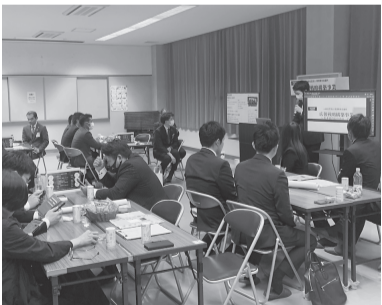
熱心に意見を交わすメンバー

今回の事業は意見を出して終わりではなく、出された意見を実践することで初めて意義のある事業だと思えますので、今事業をきっかけとして積極的な広報活動をしていこうと考えています。