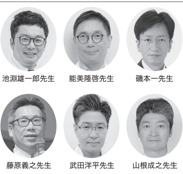
公開講座で講師を務める皆さん

最新の情報をお届けするものです。お誘い合わせの上、ぜひご参加ください(事前予約不要)。