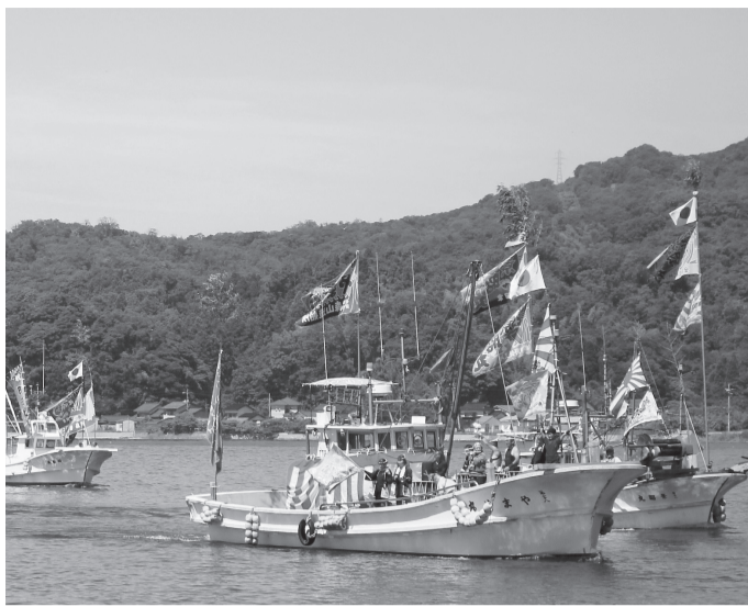
境港や米子などの漁船約50隻が参加する海上パレード

同まつりは、大港神社の祭神である事代主神(恵比寿様)に、海上安全と大漁や豊漁を祈願する「大漁祈願祭」で始まり