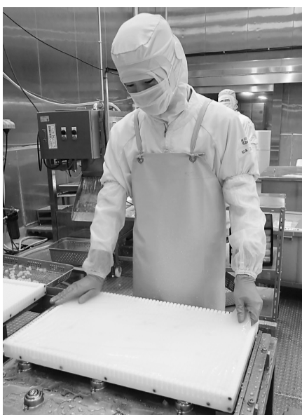
ナタデココを製造する工場のスタッフ

工場は、フジッコの「おまめさん」や「フルーツセラピー」などの製品を製造。併せて、ナタ