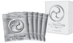
▲金持(かもち)神社の縁起物

「澤井珈琲」のオリジナルドリッパック専用自動販売機のラインナップがリニューアルされました!今回新しく加わったのは、鳥取県日野郡に位置する「金持(かもち)神社」とのコラボ商品です!他にも「ゲゲゲの鬼太郎」や「名探偵コナン」とのコラボ商品などがあります。ぜひお土産やご進物にいかがでしょうか!