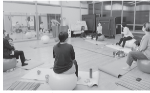
バランスボールで産後ケアを実施