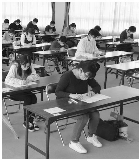
真剣な表情で問題に取り組む受験者ら＝昨年の妖怪検定境港会場

妖怪検定の実施日は、 10月15日 です。受験申し込みの期間は、 9月1日 から 9月15日 まで。会場はこれまで通り、 境港会場が境港商工会議所 です。